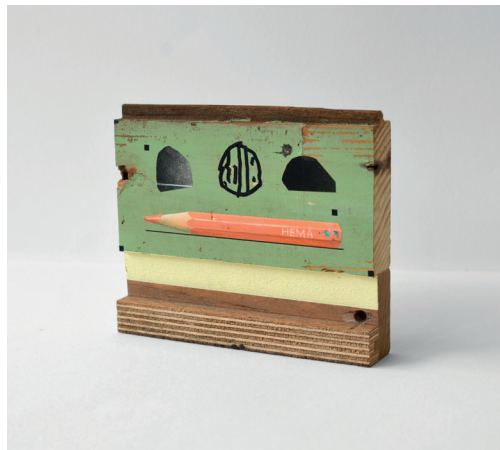
Trashures 1.30, mixed media

Op stukjes resthout verbeeldt Tineke haar vondsten, zoals stenen en takjes. Dat doet ze realistisch en verfijnd, maar ook geabstraheerd en impulsief in composities zoekend naar contrast en balans. Samen met eenvoudige grafische elementen vormen ze Trashures (trash / treasures).