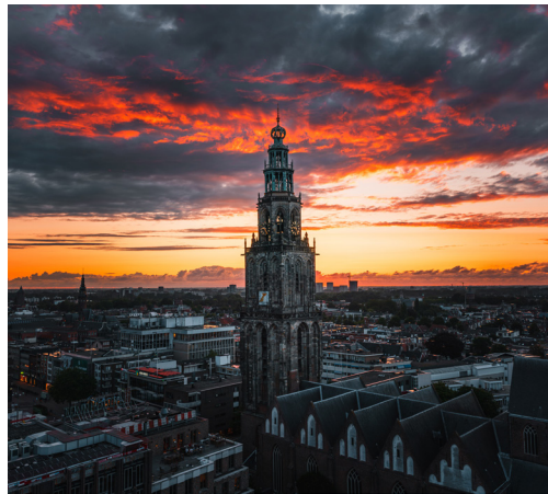
Foto van Martinitoren