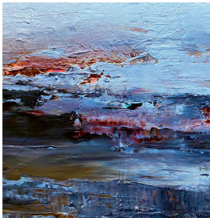
Schilderij, acryl op linnen