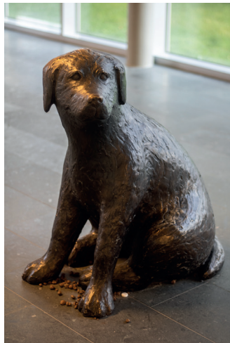
Hond, Yvonne Visser