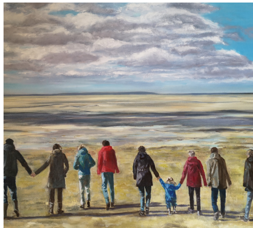
Schilderij in lijst